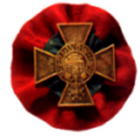
Крест защитников Львова